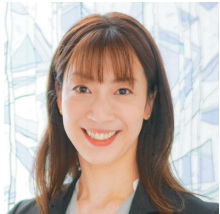
寺川 綾 ミスノ (元水泳選手)